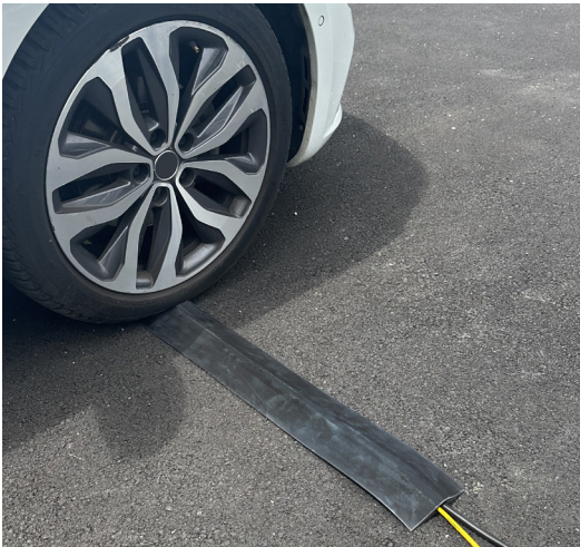
VOLGA sans adhésif