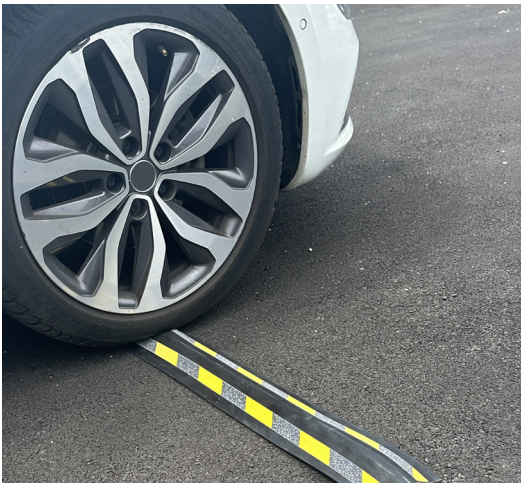
VOLGA avec adhésif