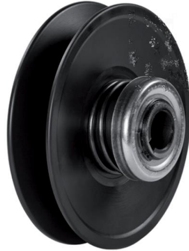
TABELLA DIMENSIONALE (mm) - DIMENSIONS TABLE - GRÖSSENTABELLE