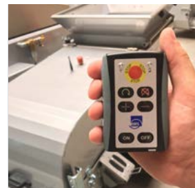
Avec une télécommande pratique