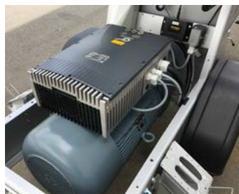
Le moteur électrique 22 kW

Les atouts dans un clin d'œil : Pas de maintenance, pas de frais de diesel, pas de frein. Nécessite uniquement un permis de conduire pour voitures particulières. Facile à nettoyer grâce à une large ouverture de purge. Grille pivotable et très résistante.