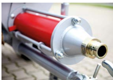
Convoyeur à vis RED FIRE