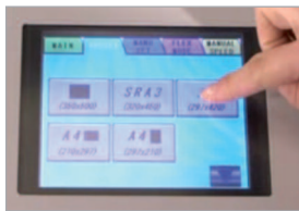
Écran tactile en couleur et en français