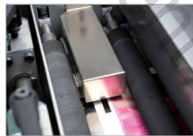
Lecteur de repère (adapté à l'impression numérique)