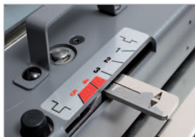
Réglage de profondeur de rainage selon le type de papier