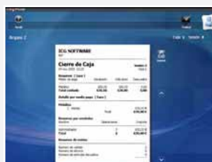
8 - Rapport de caisse de fin de journée Z