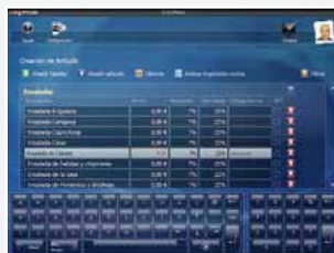
4 - Saisissez les prix et la TVA et créez vos nouveaux articles