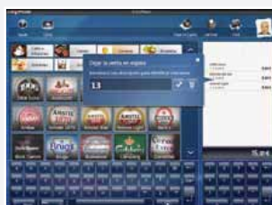
7 - Ventes en attente