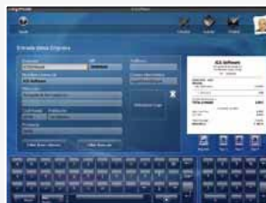
2 - Introduisez les informations de votre entreprise