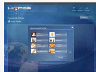
3 - Sélectionnez vos familles, articles et images et configurez-les comme vous le souhaitez