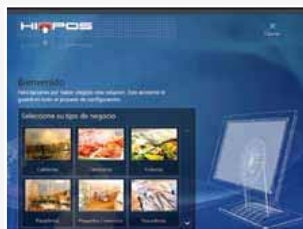
1 - Sélectionnez votre secteur d'activité