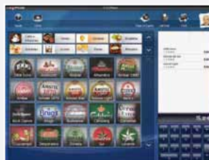
5 - Terminal prêt à vendre