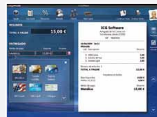
6 - Total des ventes et ticket de caisse imprimé