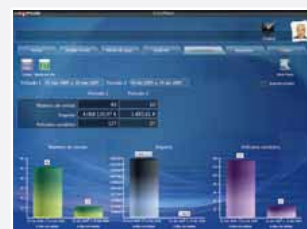
9 - Module de statistiques perfectionné