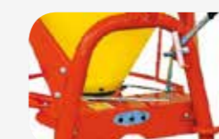
Accrochage au troisième point CAT I et II