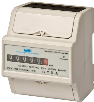
Affichage mécanique ref MCI : 031043

compteur totalisateur de kWh - réseau monophasé - branchement direct fixation modulaire - livré avec caches-bornes plombables