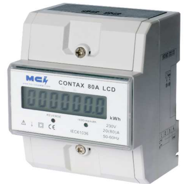
Affichage LCD ref MCI : 031041