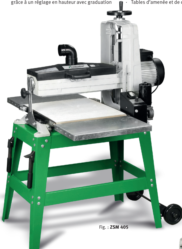
Fig. : ZSM 405