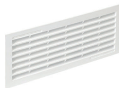
Option: grille de ventilation PVC avec fermetures