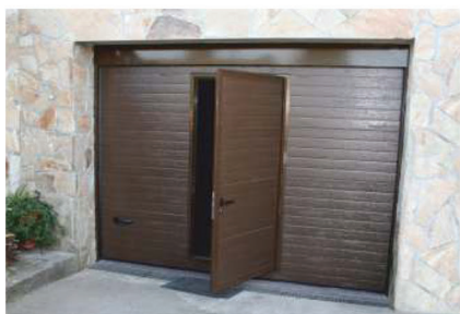
Option: porte piétonne (800x2000mm)

Les encombrements pour l'installation de la porte devront posséder une dimension minimum pour les écoinçons de 80 mm, et pour les linteaux de 100 mm.