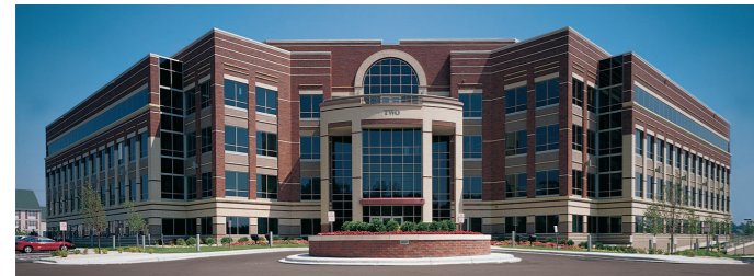
Primera Technology, Inc. É.-U.A.