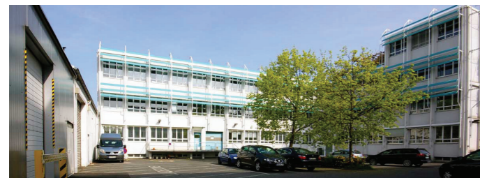
Primera Technology Europe, Allemagne

Primera Technology est un des fabricants leader d'imprimantes spécialisées. Nous avons produit plus d'un million d'imprimantes à transfert thermique, jet d'encre ou matricielle au cours de notre histoire. Vous pouvez être assuré en toute confiance que votre nouvelle imprimante d'étiquettes couleurs Primera vous donnera des années de satisfaction et de performances. Le meilleur de tous, le LX900e livre vraiment résultats professionnels à un prix accessible !