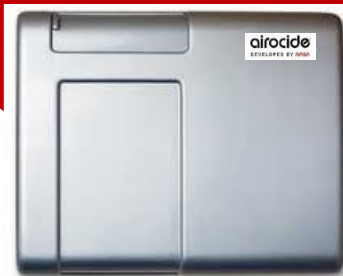
Purificateur d'air airocide®