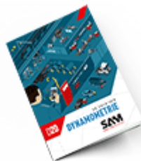
Dynamométrie SAM 2020