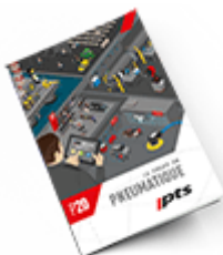
Pneumatique SAM 2020