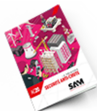
Sécurité anti-chute SAM 2020