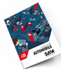
Automobile SAM 2020