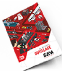
Outils SAM 2020