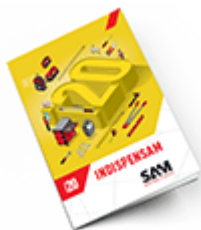
Les outils Indispensables SAM 2020

Découvrez tous nos produits dans nos catalogues en ligne