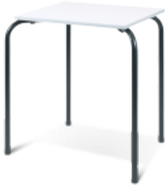
Table d'examen empilable

Table d'examen individuelle Départ usine 4 à 5 sem.