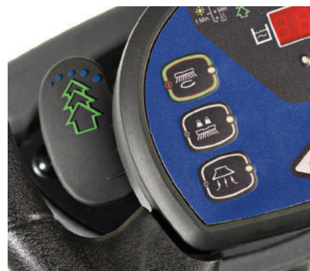
Une palette permet d'activer et de désactiver le système Ecoflex