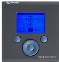
Tableau de commande Blue Power

Une solution pratique et bon marché pour une surveillance à distance, avec un bouton rotatif pour configurer les niveaux de Power Control et Power Assist.