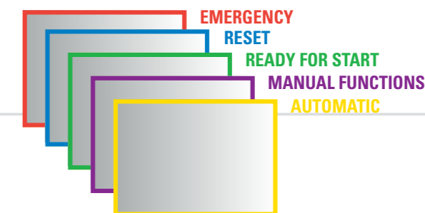
BORD COLORÉ ÉTAT MACHINE FARB-ANZEIGELEISTE DES MASCHINENSTATUS