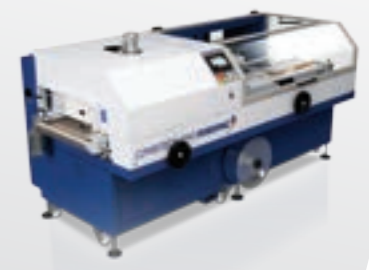
Machines conditionneuses Verpackungsmaschinen