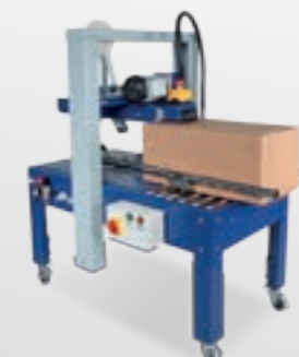
Fermeuses de caisses carton Bandwickelmaschinen