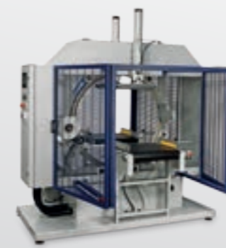
Banderoleuses horizontales Horizontale Wickelmaschinen