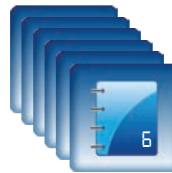
6 PROGRAMMES CONFIGURABLES 6 KONFIGURIERBARE PROGRAMME