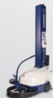
Robot automoteur Selbstfahrende Roboter

DANS LE DOMAINE DE L'EMBALLAGE, LA GAMME DE PRODUCTION DE RO-BOPAC SE SUBDIVISE SELON LES TYPES SUIVANTS DE MACHINES : IM VERPACKUNGSBEREICH LÄSST SICH DIE PRODUKTIONSREIHE VON ROBOPAC IN FOLGENDE MASCHINENTYPEN UNTERGLIEDERN: