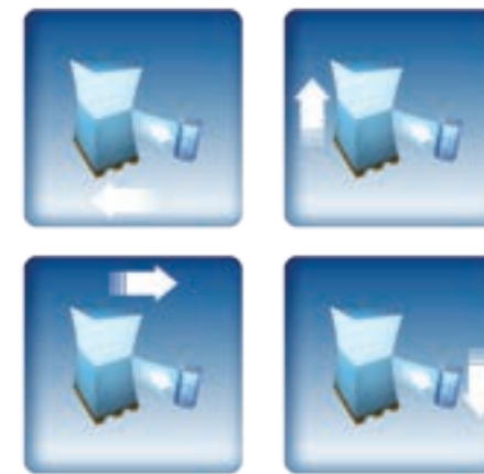
4 TENSIONS DE FILM RÉGLABLES 4 EINSTELLBARE FOLIENSPANNUNGEN