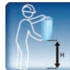
ARRÊT ERGONOMIQUE DU CHARIOT ERGONOMISCHER SCHLITTENHALT