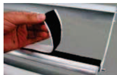
Système velcro pour un changement de visuel facilité