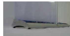
Nouveau Design épuré