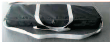
Sac en canevas et carton individuel