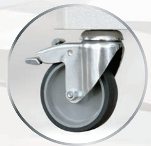
Option pieds avec roulettes pivotantes ∅75 ou 125 mm.