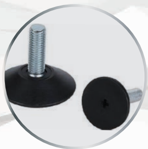
Option vérins de mise à niveau