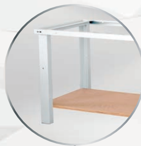
Option tablette basse