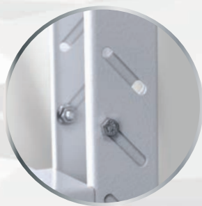
Pied réglable, robuste et stable