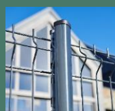
Poteau AXOR® PLUS À sceller ou sur platine