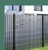
Occultation LIXO® Horizontal