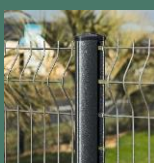
Poteau AXIS® À sceller ou sur platine