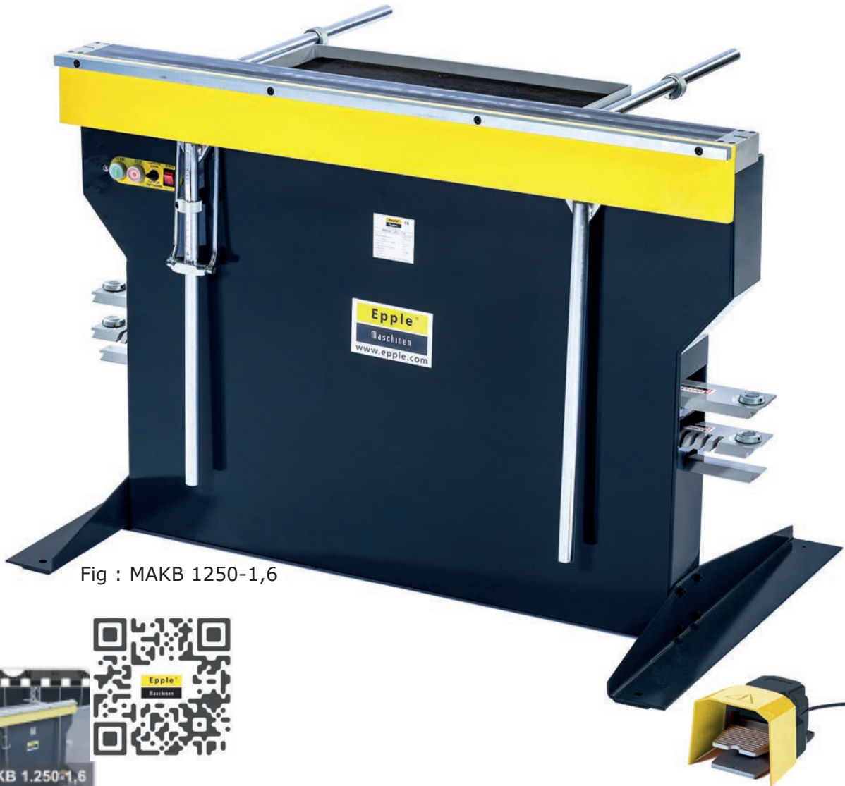
Fig : MAKB 1250-1,6