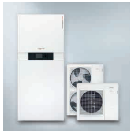
Vitocaldens 222-F avec unités extérieures

Le générateur hybride compact Vitocaldens 222-F est d'ores et déjà conçu pour l'auto-consommation de l'électricité produite par une installation photovoltaïque. Grâce à cette fonctionnalité les composants électriques fonctionnent à plus faible coût.