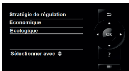
Régulation Vitotronic 200 avec Hybrid Pro Control