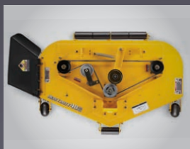
PLATEAU DE COUPE MÉCANO-SOUDÉ