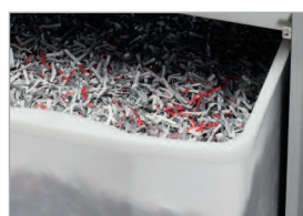
Réceptacle pratique avec poignée de préhension