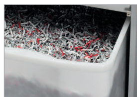
Réceptacle pratique avec poignée de préhension