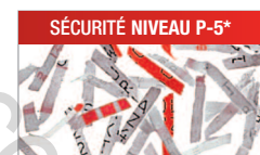
Modèle C/C - 2x15 mm Pour les documents confidentiels ou secrets.