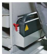
Chariot motorisé avec valisette batterie