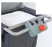
Vendu nu sans produits.