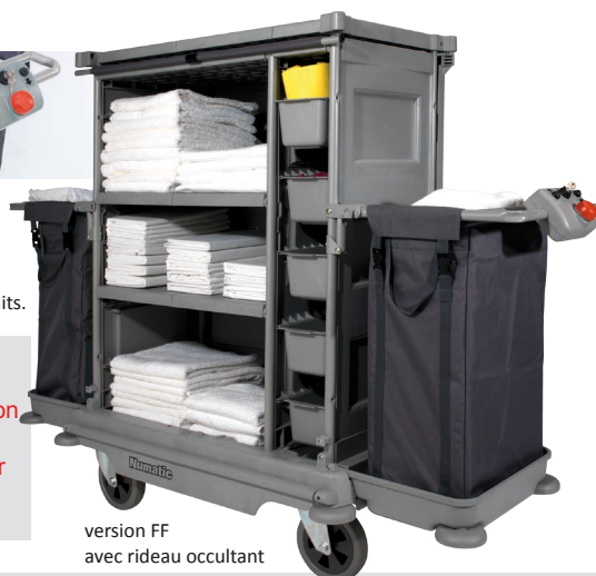
version FF avec rideau occultant

Ces chariots existent en version basse SPL17 (h.1115mm) sur commande.