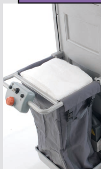
Sur version HF - bacs de rangements avec couvercles sur le dessus