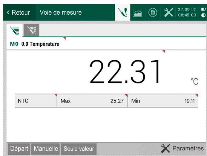
Grand affichage de la valeur de mesure