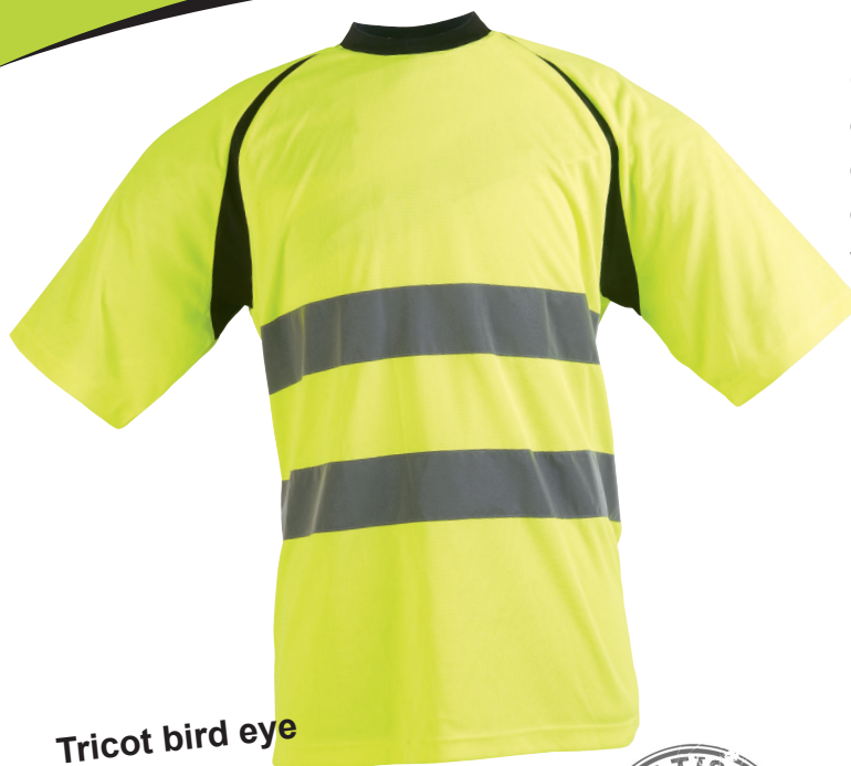
Tricot bird eye