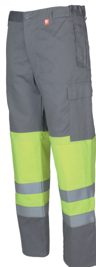
Jaune Fluorescent / Gris Acier 97