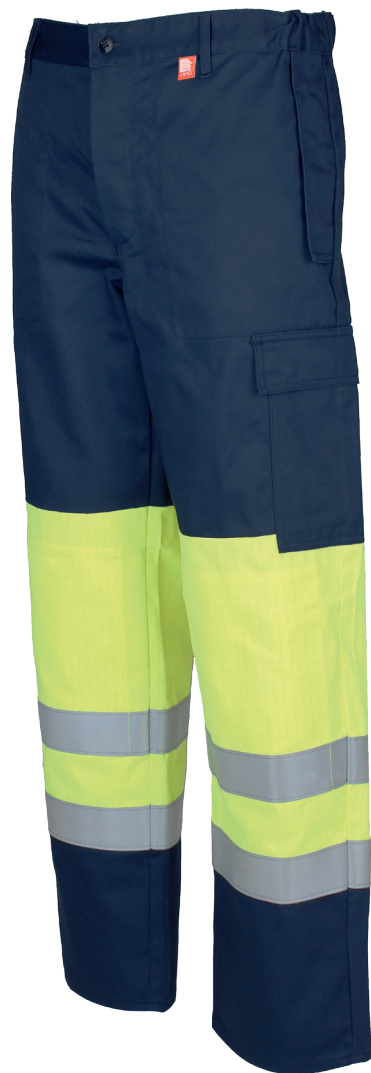
Jaune Fluorescent / Marine 96