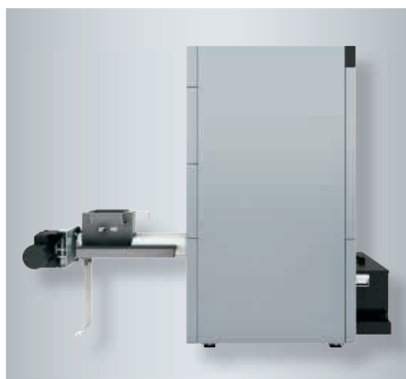
Vitoligno 300-H (50 et 60 kW) avec l'alimentation par l'arrière et installation flexible à faible encombrement

Vitoligno 300-H - pour l'alimentation automatique avec des granulés de bois ou des plaquettes forestières