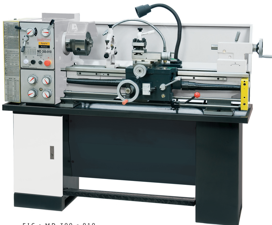
FIG.: MD 300 - 910

Pour les détails techniques, voir page 63