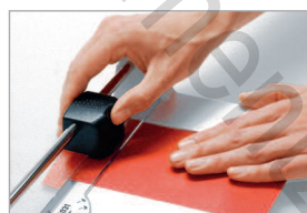
Rapporteur pour une coupe précise des angles