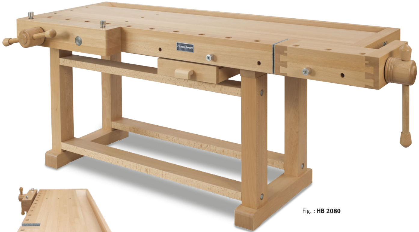
Fig. : HB 2080