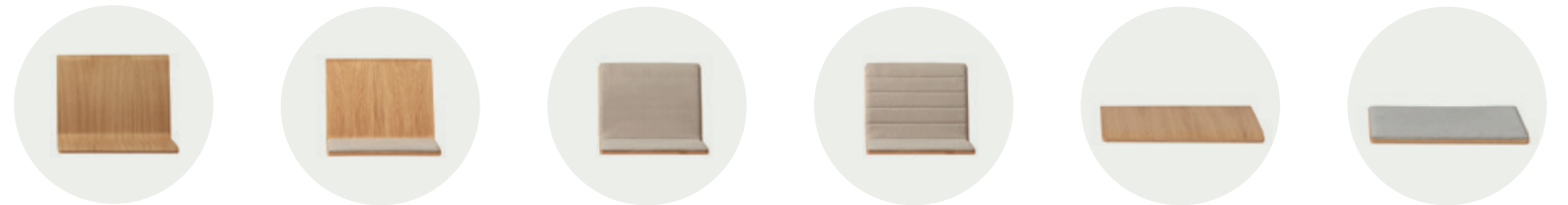
Wooden seat with backrest

LIN WOOD seats are made with oak veneers finished in all the colours of our oak sample card. Upon request, the seats can also be manufactured in beech and walnut veneers.