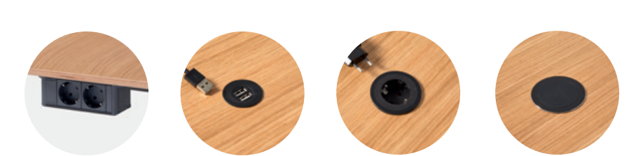
Power box with 2 Schuko plugs