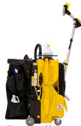
Kit consommables en option