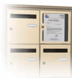
Tableau d'affichage intégré dans le bloc. (occupe 1 case du bloc)