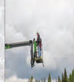
JIB - 90 °/+ 30°