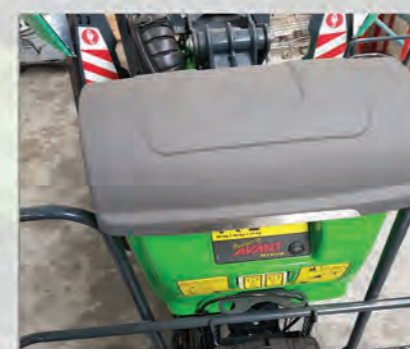
PROTECTION COMMANDE PANIER