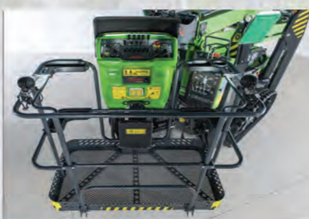
PHARES DE TRAVAIL. BAC RANGEMENTS.