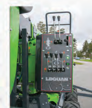
COMMANDE TRANSLATION. STABILISATION