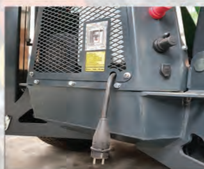
COSSES BATTERIES DEPORTEES