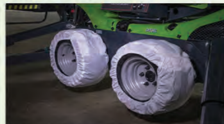
CHAUSSETTE DE PROTECTION PNEUMATIQUES