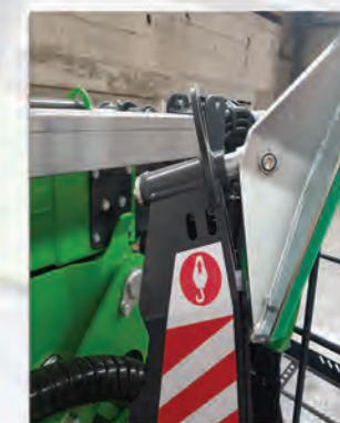
ANNEAUX DE GRUTAGE