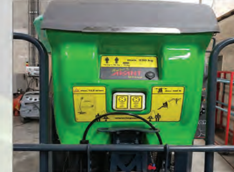
PRISES 220V et 12 V. ARRIVEE AIR/EAU DANS LE PANIER