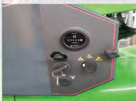
DESCENTE D'URGENCE POSTE BAS