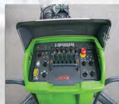
POSTE DE COMMANDE PANIER