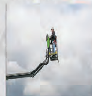
JIB - 90 °/+ 30°