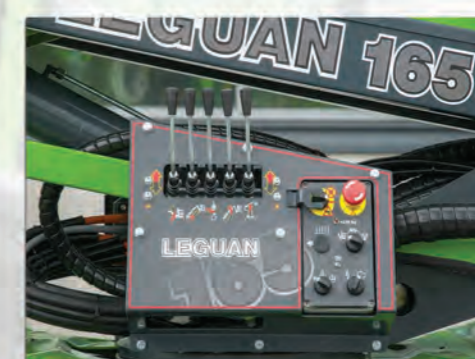
POSTE DE COMMANDE BAS