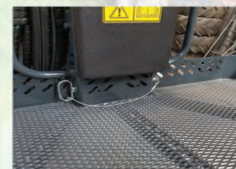
DEMONTAGE DU PANIER RAPIDE ET SANS OUTILS