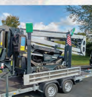
REMORQUE DE TRANSPORT