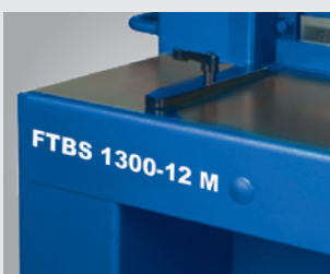
• Butée angulaire réglable (livrée de série)