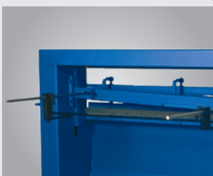
• Butée arrière de série avec échelle graduée en millimètre