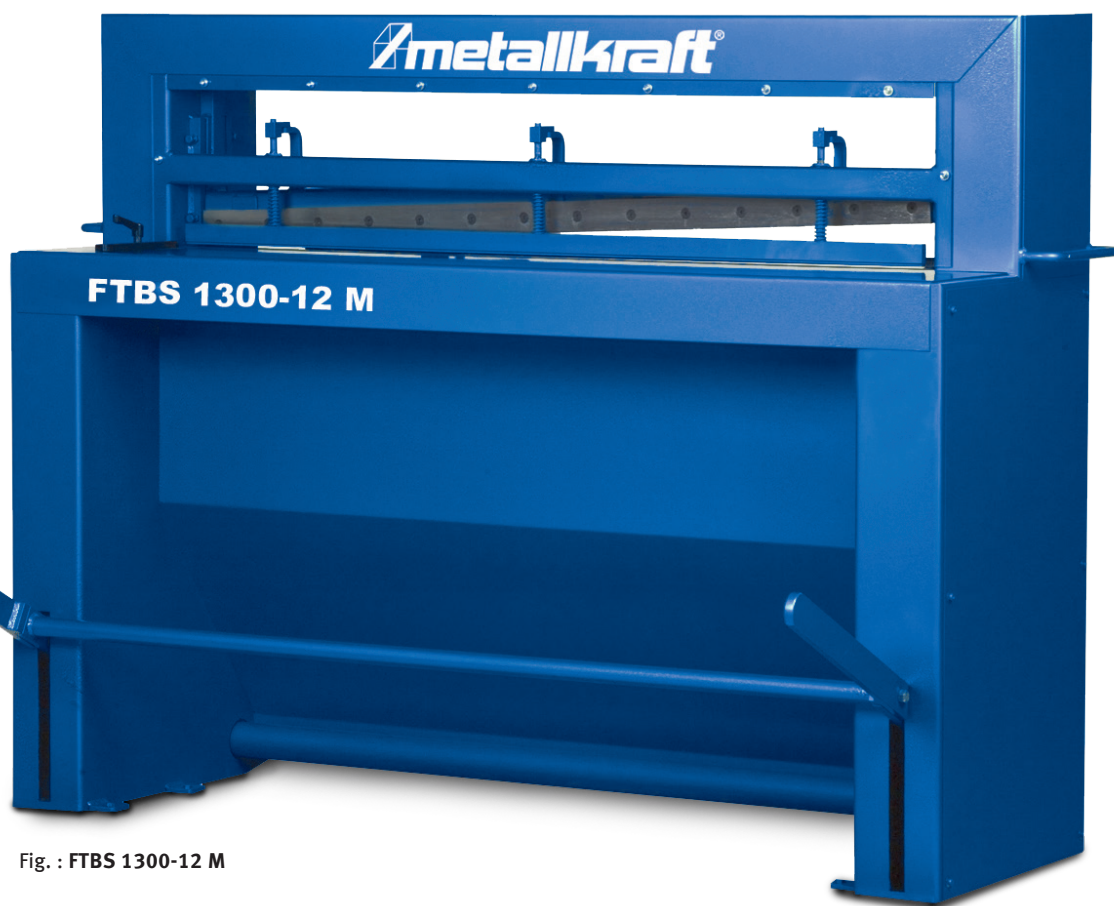
Fig. : FTBS 1300-12 M