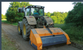
01 Broyeurs de pierres

Postfach 315 CH-4242 Laufen Tel. +41 (0) 61.761.55.00