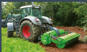
02 Broyeurs multi-terrains