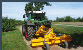
03 Lames niveleuses