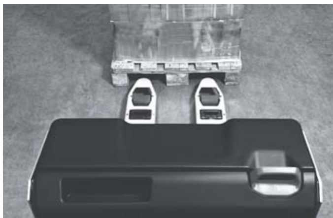
Visibilité sans obstacle sur les fourches