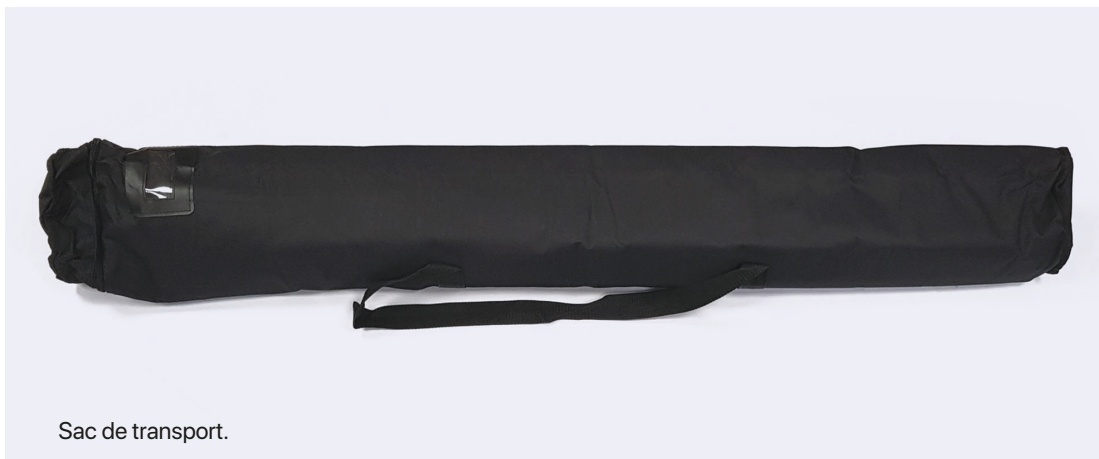
Sac de transport.