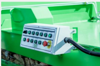
Commande supplémentaire de série