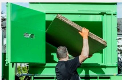
Grande chambre de remplissage