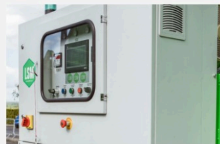
Panneau de commande entièrement fermé