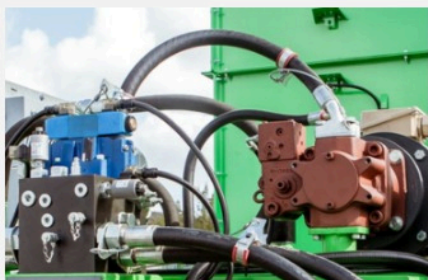
Système hydraulique haute capacité