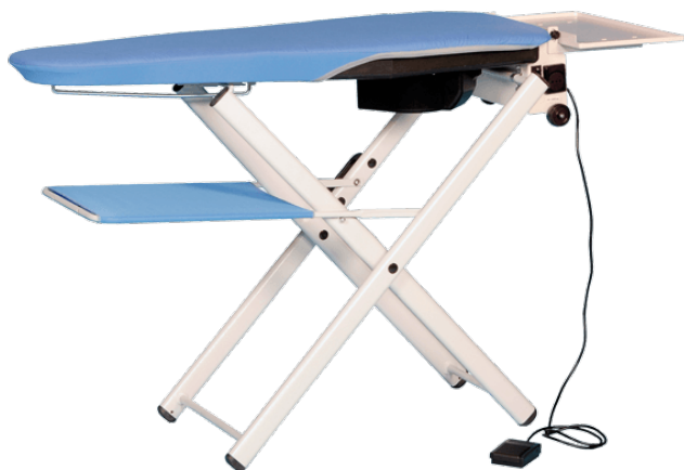
Table à repasser pliante PLIA