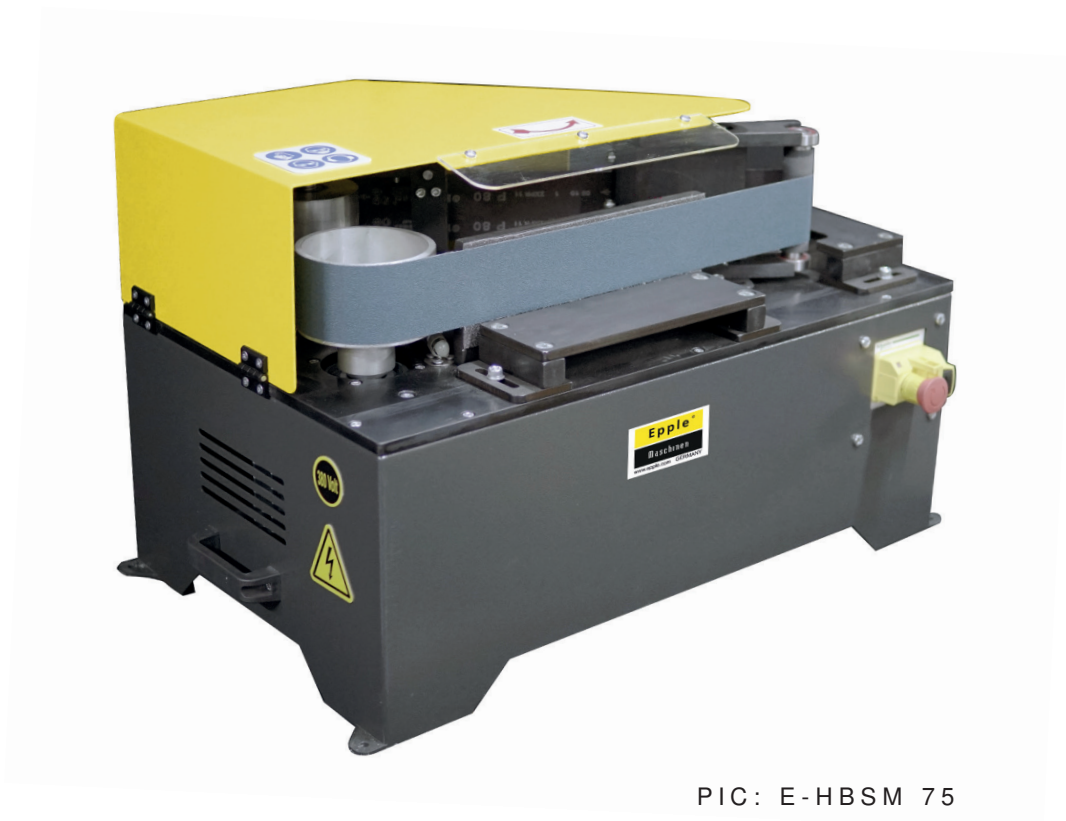
PIC: E-HBSM 75