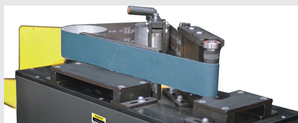
FIG: STATION DE PONÇAGE 2