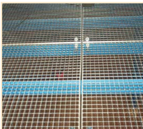
Solution avec recouvrement en caillebotis