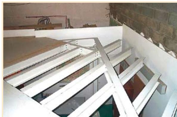
Vos angles ne sont pas toujours à 90 ° Adaptation aux contraintes bâtiment