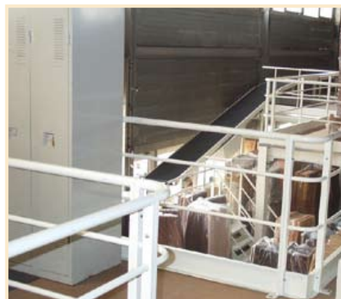
Garde-corps acier normalisé