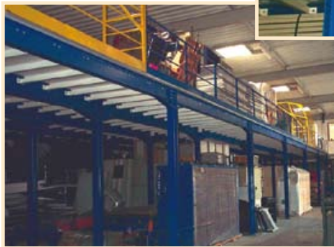
Structure sur poteaux avec renforts de stabilisation

Jusqu'à 1500kg au m 2 en charge roulante