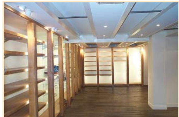
Structure aménageable (éclairage, supports produits, etc ...)