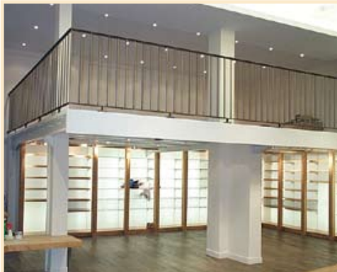
Le savoir faire industriel au service de l'aménagement