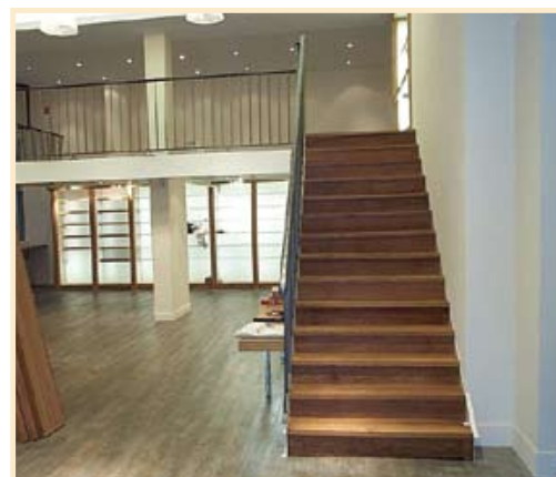
Escalier avec structure métallique et marches en bois