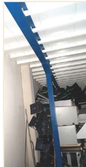
Porte à faux adapté au bâtiment