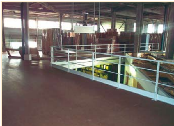
Plancher bois forte densité