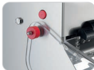
Microinterruttore di sicurezza su coperchio Safety micro-switch on lid.