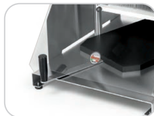
Piano in polietilene con movimento libero Mobile polyethylene cutting board