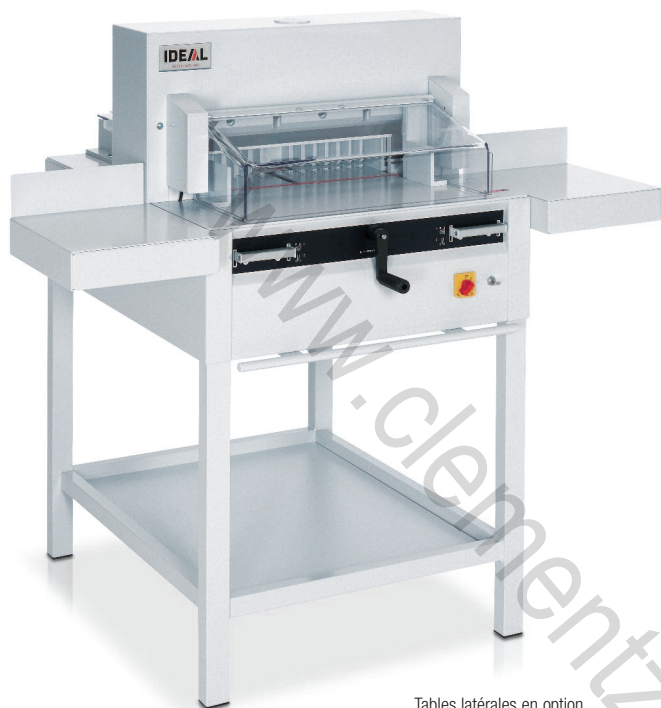
Tables latérales en option