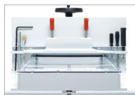
Porte-outils pratique et amovible sur la table arrière

La commande bi-manuelle EASY-CUT, le dispositif de pression automatique et la matérialisation optique de la ligne de coupe donnent à ce massicot électrique toute l'assurance d'une coupe rapide et très précise.