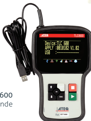
TLC 600 Télécommande