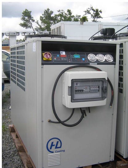
HLA 040 & 50