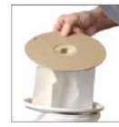
Fleece filter bag and textile filter