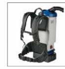
Shoulder straps + accessory