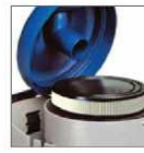
Cartridge filter (HEPA optional)