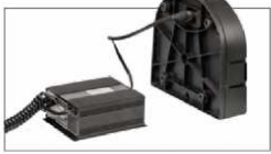
Chargers and battery