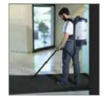
Light and comfortable