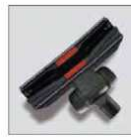
Floor tool RD 285