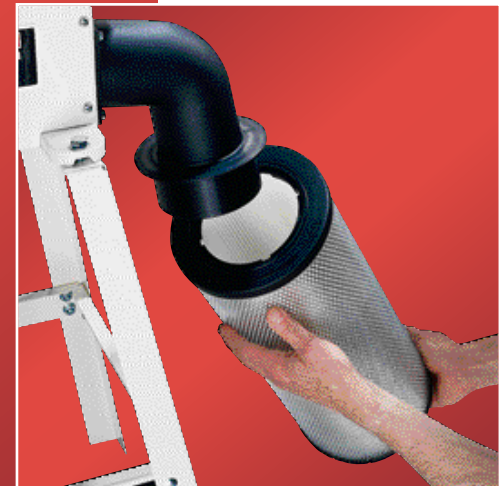
Cartouche de filtres avec raccord en coude 90° (accessoire)