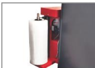
Chariot de pré étirage du film