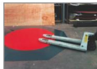
Accès facile au transpalette