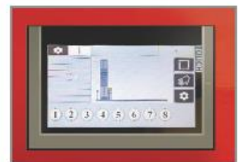
Ecran de contrôle 7.2"