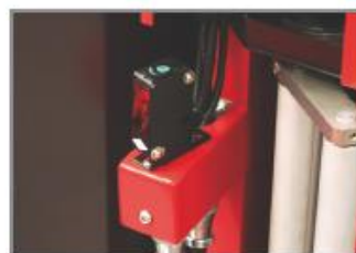
Cellule de détection hauteur